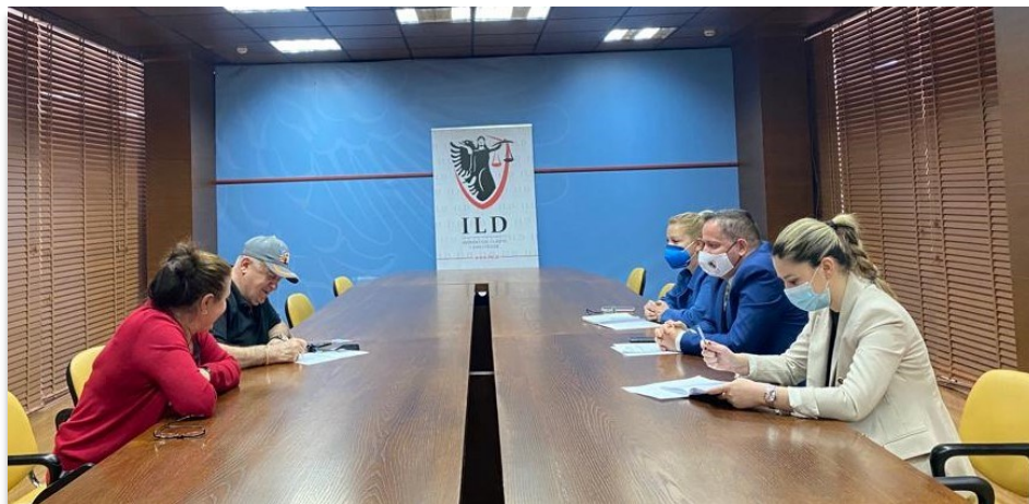
Gjatë takimit të Sektorit me ankues

Komunikimi me qytetarët është pjesë e punës së përditshme të Inspektorit të Lartë të Drejtësisë. Sektori i ankesave në ILD është përgjegjës për garantimin e të drejtës së informimit të qytetarëve dhe transparencën ndaj publikut. Ky sektor ndjek gjurmueshmërinë e ankesave në sistem dhe jep përgjigje për ankuesit, mbi fazën ku ndodhet ankesa e tyre.