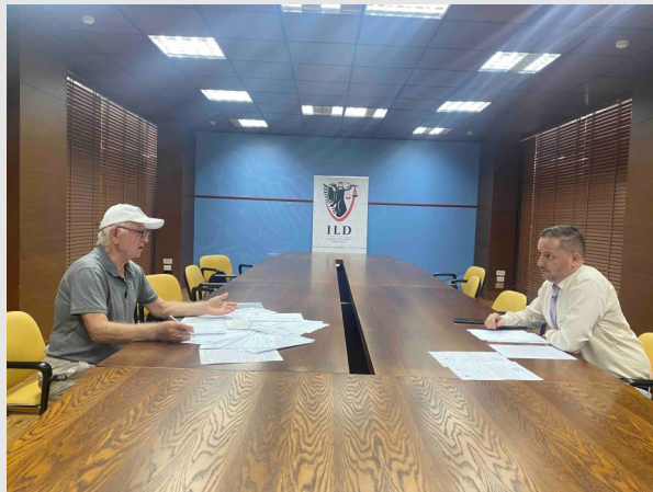
Gjatë asistimit të ankuesve

Komunikimi me qytetarët është pjesë e punës së përditshme të Inspektorit të Lartë të Drejtësisë. Sektori i ankesave në ILD është përgjegjës për garantimin e të drejtës së informimit të qytetarëve dhe transparencën ndaj publikut. Ky sektor ndjek gjurmueshmërinë e ankesave në sistem dhe jep përgjigje për ankuesit, mbi fazën ku ndodhet ankesa e tyre.