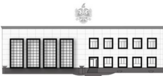
REPUBLIKA E SHQIPËRISË INSPEKTORI I LARTË I DREJTËSISË