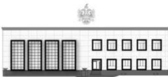
REPUBLIKA E SHQIPËRISË INSPEKTORI I LARTË I DREJTËSISË