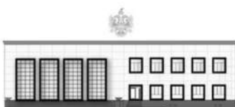
REPUBLIKA E SHQIPËRISË INSPEKTORI I LARTË I DREJTËSISË